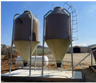
SILO DE STOCKAGE