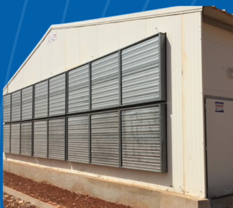
VENTILATION PAR TURBINE D'EXTRACTION