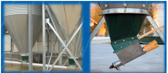
VIS D'ALIMENTATION DES CHÂÎNES