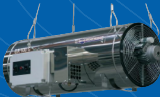
GENERATEUR D'AIR CHAUD