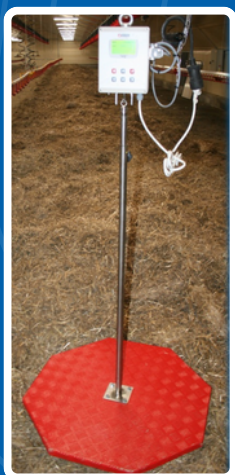
PESAGE VOLAILLES AUTOMATIQUE